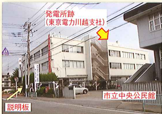
写真2 川越火力発電所跡(現東京電力川越支社) 発電所は、支社建物の右の方にありました。

現地を訪ねたところ、川越火力発電所があったと思われる場所には、東京電力株式会社の川越支社があり、住所は三久保町17-4でした。