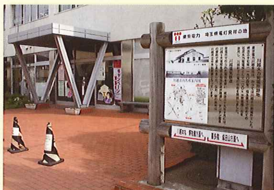
写真3 川越支社前に設置されている説明板

発電所でつくられた電気を使い、明治三十九年十月には、川越～大宮間を結ぶ電気鉄道が開通し、チンチン電車の愛称で親しまれました。なお、駅の跡地は川越市立中央公民館となっています」