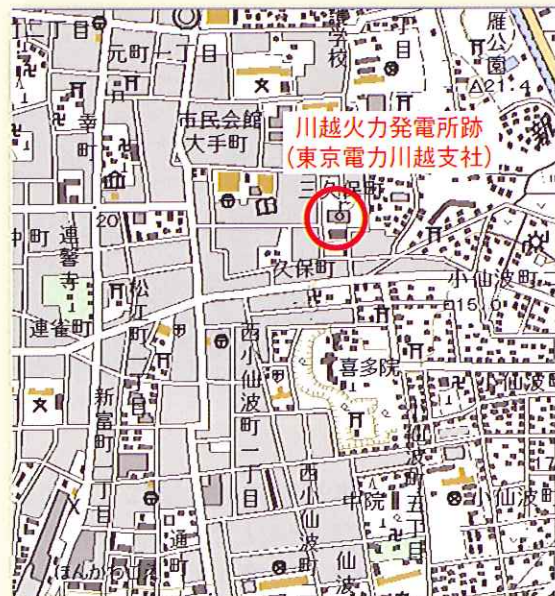
図2 現在の地図 国土地理院2万5千分の1地形図使用