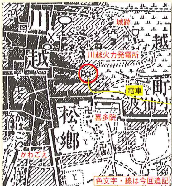
図1 明治40年の地形図(大日本帝国陸地測量部) 国土地理院旧版地図(川越)使用

明治時代の地図(図1)を参考に、現在の地図(図2)において発電所の位置を追うと、喜多院の位置と道路区画に注目することで「川越火力発電所跡」と記した赤丸印のところに なります。