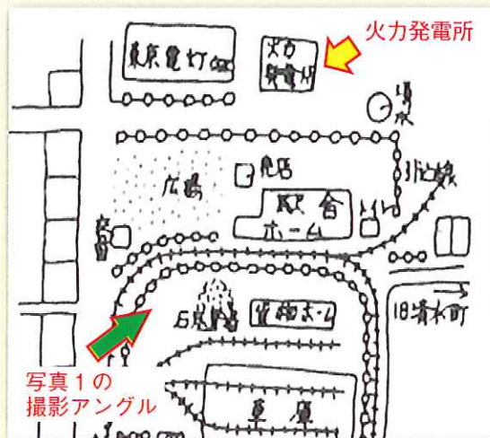
写真4 昭和2年頃の久保町駅構内と駅前図 発電所、駅舎、線路などの位置が、写真1(明治44年)と変わっていないことが分ります。